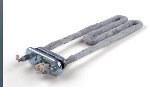
Defekte an Heizelementen